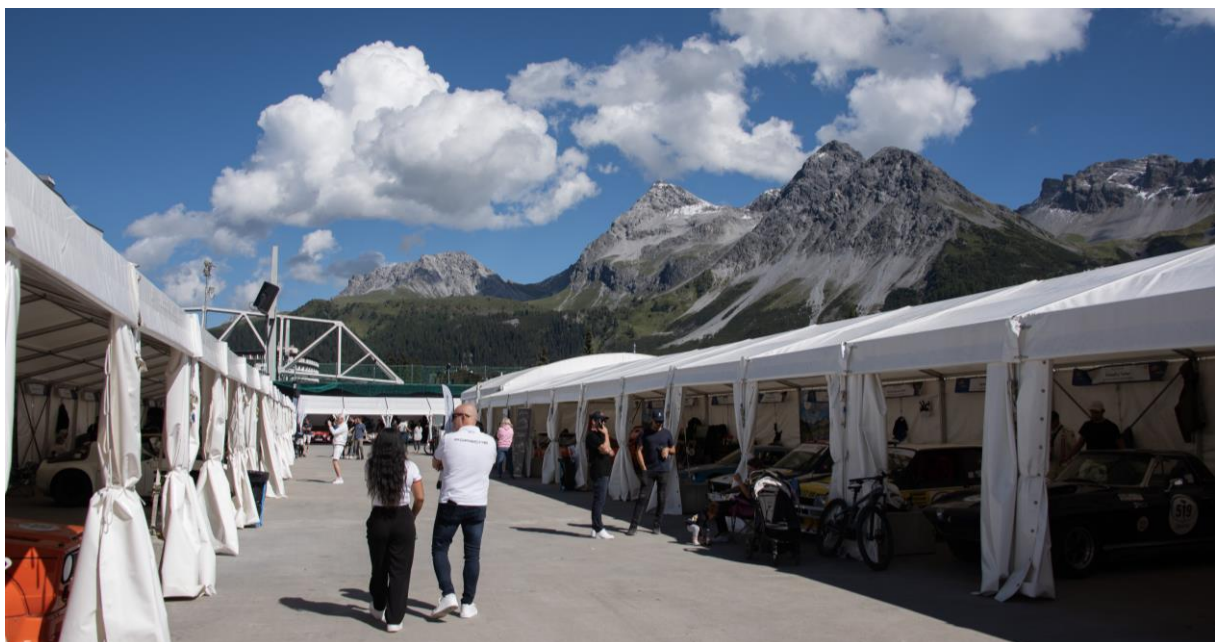
Fahrerlager 1 - Ochsenbühl Arosa ClassicCar