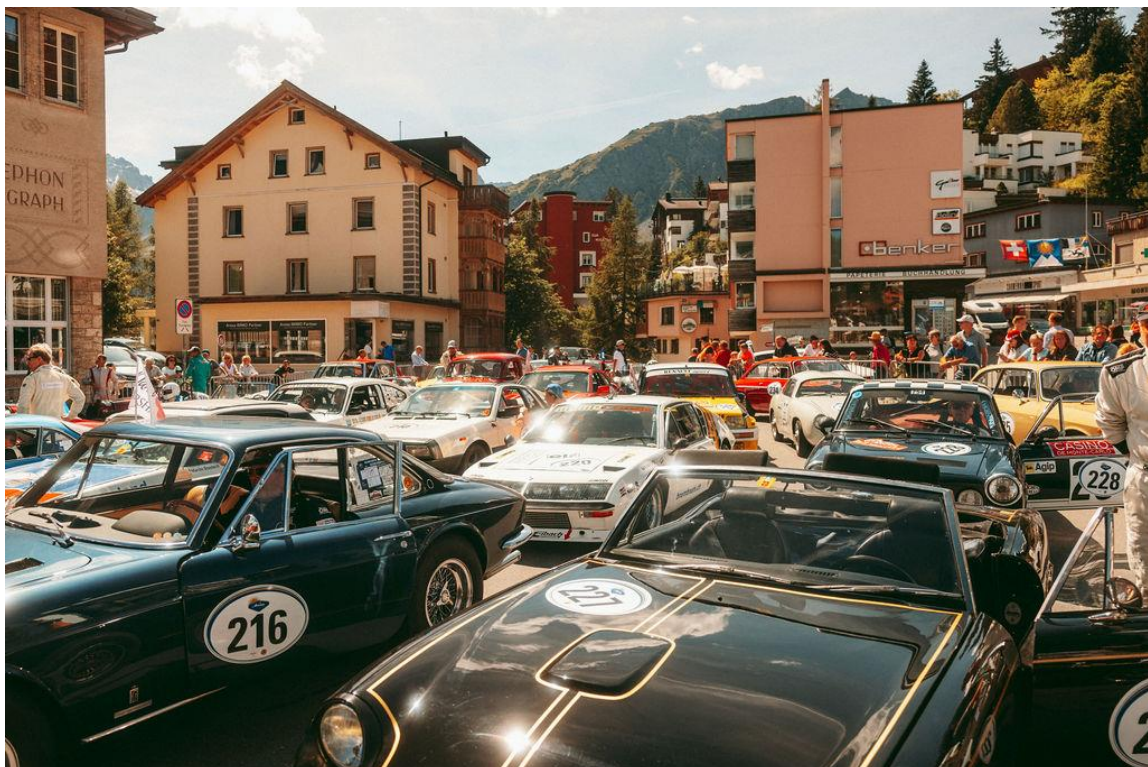
Aufreihung der Fahrzeuge für die Überführung an den Start Arosa ClassicCar