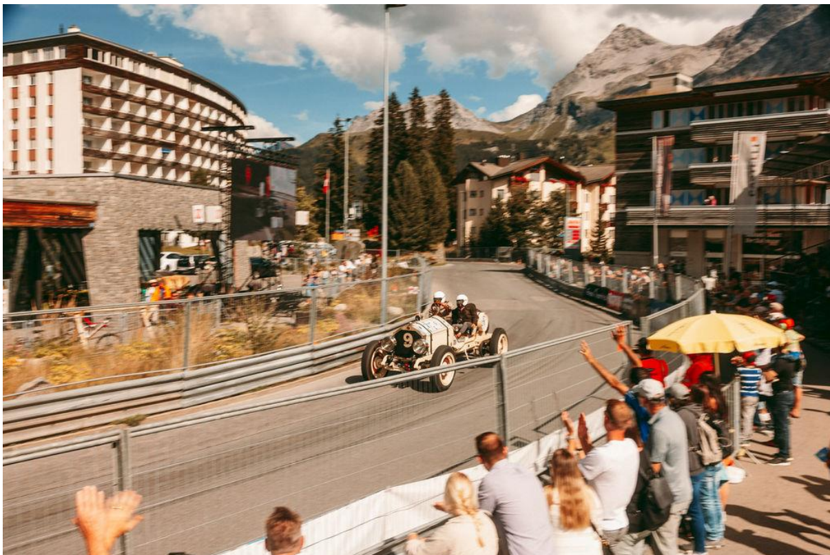
Blick auf die Rennstrecke

Arosa hat aus kulinarischer Sicht einiges zu bieten. Entdecken Sie das gesamte Restaurantangebot online .